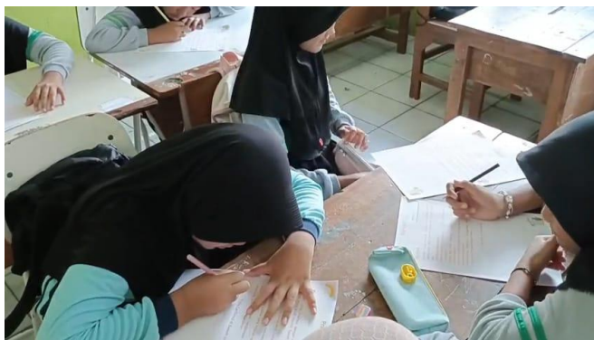
Gambar 2. Murid mengerjakan pretest

Penelitian ini menggunakan desain quasi-eksperimen dengan model pretest-posttest pada satu kelompok untuk mengetahui efektivitas media video cerita digital terhadap keterampilan menulis narasi sugestif murid kelas IV SDN Durungbedug. Penelitian ini berlangsung selama tiga hari yaitu pada tanggal 7, 13 dan tanggal 26 di bulan Januari 2026. Pada tahap awal pembelajaran murid diberikan pretest berupa tes tulis agar dapat mengetahui kemampuan mereka dalam menulis narasi sugestif.