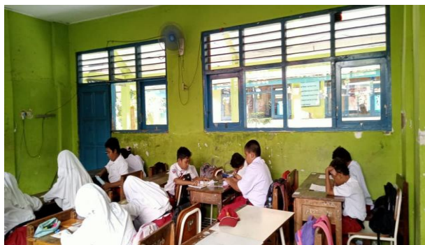
Gambar 4. Murid mengerjakan posttest

Setelah mendapatkan perlakuan, murid diberikan posttest berupa tes tulis dengan tingkat dan kesulitan yang sama pada pretest.