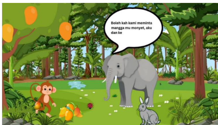
Gambar 3. Tampilan Cuplikan Video Cerita Digital

Selanjutnya, murid diberikan media video cerita digital, video ini menyajikan cerita melalui gambar dan suara, sehingga murid memahami alur cerita dengan lebih baik, meningkatkan semangat belajar mereka, serta merangsang imajinasi mereka dalam menulis. Berikut gambar 3 menunjukkan tampilan media video cerita digital yang diterapkan di SDN Durungbedug.