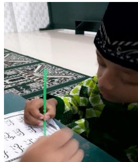
Gambar 2. Proses Pembelajaran