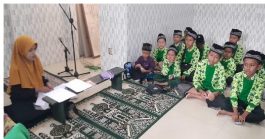
Gambar 1. Proses Pembelajaran