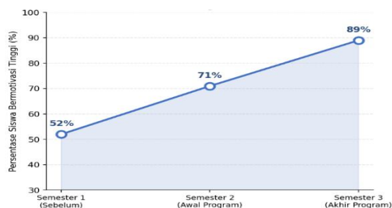
Gambar 2. Perkembangan Motivasi Belajar PAI

Gambar 2 memperlihatkan bahwa persentase siswa dengan motivasi belajar PAI yang tinggi meningkat tajam dari 52% pada semester sebelum program, menjadi 71% di awal program, dan mencapai 89% pada akhir program. Hasil ini mengindikasikan bahwa pembelajaran PAI berbasis dakwah kreatif secara konsisten mampu mendorong motivasi dan pengembangan kompetensi siswa secara berkelanjutan.