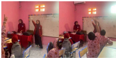
Gambar 4. Proses Pembelajaran Interaktif Menggunakan Flashcard

Sepanjang proses pembelajaran, siswa menunjukkan antusiasme dan keterlibatan aktif yang besar dalam setiap aktivitas yang disajikan melalui media visual. Antusiasme mereka terlihat dari keinginan mereka untuk memahami isi Tajwid, partisipasi mereka dalam diskusi, dan jawaban tepat waktu mereka atas pertanyaan-pertanyaan. Kartu flash dan alat bantu visual lainnya telah terbukti mampu menjaga perhatian siswa sekaligus meningkatkan pemahaman dan kesenangan mereka terhadap materi pelajaran. Hal ini menciptakan suasana belajar yang merangsang dan mendorong siswa untuk fokus dan mempelajari aturan Tajwid dengan lebih teliti.