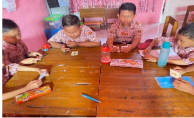
Gambar 2. Implementasi Media Flashcard

instruktur kemudian menyajikan konten secara bertahap, dimulai dengan idzhar dan berlanjut melalui idgham bighunnah, idgham bilaghunnah, ikhfa', dan iqlab. Tes akhir digunakan untuk mengukur kemampuan siswa setelah proses pembelajaran interaktif yang mencakup media kartu flash.