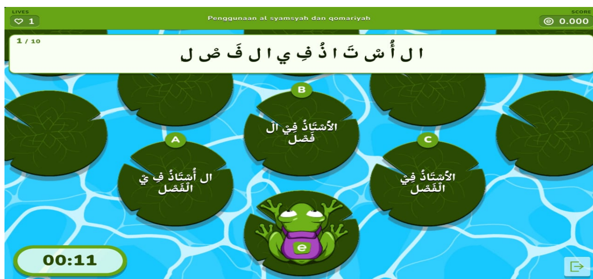
Gambar 1.2 Tampilan Media Interaktif froggy jump

Tahap pelaksanaannya penulis memanggil setiap kelompok untuk menyelesaikan kuis secara bersama. Dapat berdiskusi dengan kelompoknya dan menjawab sesuai dengan waktu yang disediakan. Setelah 3 kelompok telah mengerjakan kuis tersebut. maka tahap berikutnya yaitu evaluasi, penulis dapat membahas beberapa jawaban yang kurang benar dengan memberikan arahan yang sesuai dengan materi. Kekurangan dari media froggy jump yaitu ketika menggunakan froggy jump yaitu pada fitur jawaban hanya terdapat 3 kolom saja. Sedangkan pada jenjang SMP untuk pemilihan jawaban lebih dari 3. Kelebihan dari media froggy jump ini belajar lebih efektif melalui interaksi dan umpan balik secara cepat. Hal ini sesuai dengan Clark, R. E. menyatakan bahwa konsep games based learning peserta didik dapat tertantang dan keterlibatan dalam menyelesaikan kuis sesuai dengan target.