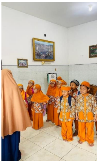
Gambar 2 : kegiatan pembelajaran

Berdasarkan hasil wawancara dengan ustadz dan ustadzah di TPQ Fastabiqul Khoirot Desa Bluru Kidul Sidoarjo, diketahui bahwa pembelajaran Al-Qur'an dengan metode Qiraati telah dilaksanakan sesuai dengan ketentuan metode. Pembelajaran dilakukan melalui tahapan jilid, diawali dengan pembacaan secara klasikal, kemudian dilanjutkan dengan penilaian individu melalui metode sorogan dengan penekanan pada ketepatan makhraj dan tajwid.