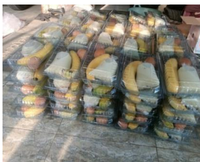
Gambar 1. PMT Desa Jambangan