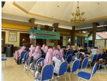
Gambar 2. Dokumentasi pertemuan rutin kader kesehatan Desa Jambangan

Berdasarkan hasil wawancara tersebut, dapat diketahui bahwa strategi Desa Jambangan dalam memastikan keberlanjutan program penurunan stunting dilakukan dengan menekankan kemandirian dan keberlanjutan di tingkat lokal. Pemerintah desa berupaya menjadikan program penurunan stunting sebagai prioritas utama dengan memasukkannya ke dalam RPJMDes dan APBDes agar memperoleh dukungan pendanaan rutin setiap tahun. Selain itu, desa juga mengoptimalkan sumber daya lokal, seperti pemanfaatan bahan pangan setempat untuk kegiatan PMT, pengembangan kebun gizi, serta pelibatan kader posyandu dan anggota PKK sebagai tenaga pelaksana utama. Upaya lain yang dilakukan adalah membangun kemandirian masyarakat melalui kegiatan edukasi, pelatihan pengolahan pangan bergizi, dan pemberdayaan ekonomi bagi keluarga berisiko stunting. Strategi ini menunjukkan bahwa desa tidak hanya bergantung pada bantuan eksternal, tetapi juga berfokus pada penguatan kapasitas internal agar program penurunan stunting dapat berjalan secara berkelanjutan.