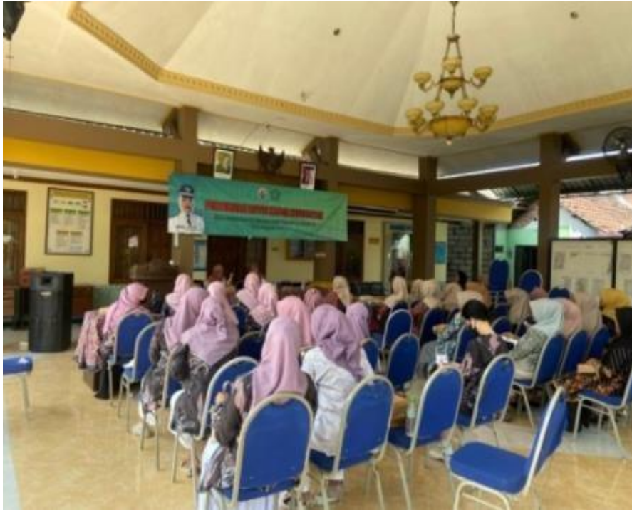
Gambar 2. Dokumentasi pertemuan rutin kader kesehatan Desa Jambangan

Pembuktian tata kelola Strategi program dalam pelaksanaan PMT di Desa Jambangan menekankan pada keberlanjutan dan dampak jangka panjang. Program stunting telah dimasukkan ke dalam perencanaan desa seperti RPJMDes dan APBDes sehingga memiliki dukungan pendanaan yang berkelanjutan. Selain itu, strategi yang dilakukan meliputi optimalisasi sumber daya lokal, pemberian edukasi gizi kepada masyarakat, serta pemberdayaan keluarga agar mampu menerapkan pola hidup sehat secara mandiri. Program ini memberikan dampak positif terhadap peningkatan kesadaran masyarakat dan kapasitas kader. Namun demikian, masih terdapat kendala seperti rendahnya pemahaman masyarakat tentang gizi, keterbatasan anggaran, serta kurangnya jumlah kader posyandu yang dapat memengaruhi efektivitas program.