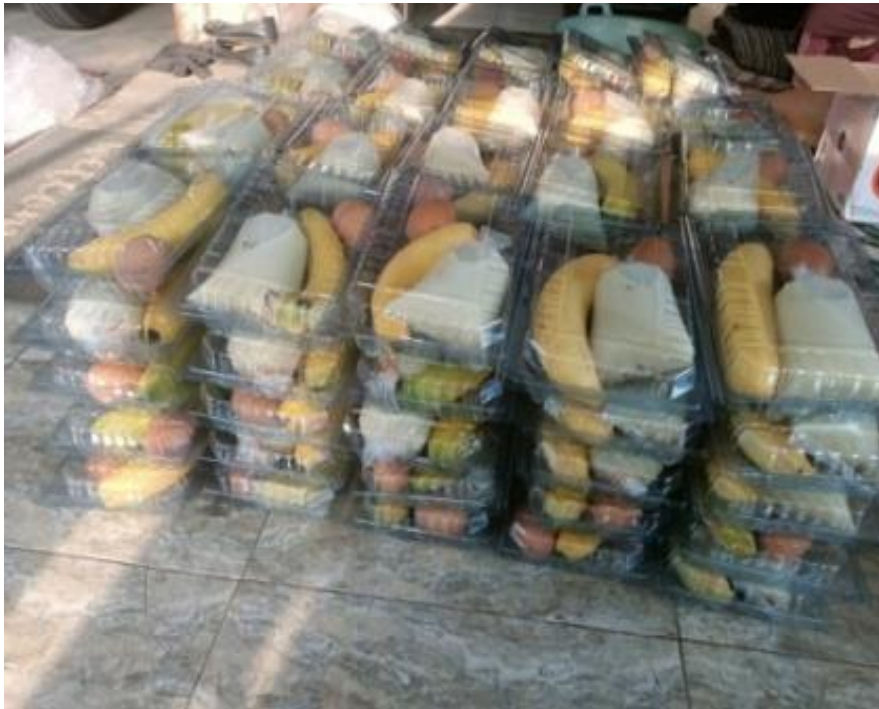
Gambar 1. PMT Desa Jambangan