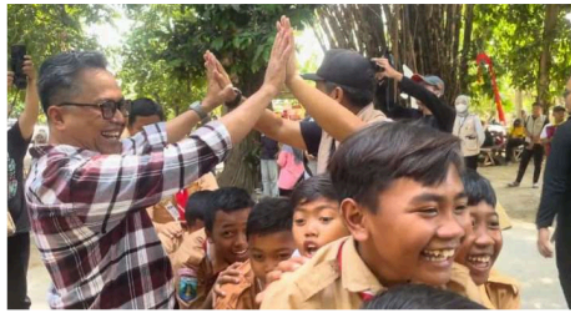
Gambar 1 ayah bermain permainan tradisional dengan anak

Sebagai respons terhadap permasalahan tersebut, berbagai inisiatif berbasis komunitas mulai bermunculan untuk menawarkan solusi konkret, salah satunya adalah Kampung Lali Gadget (KLG) di Sidoarjo. Inisiatif yang lahir dari keprihatinan para pemuda ini bertujuan mulia untuk mengembalikan keseimbangan hidup anak antara dunia digital dengan aktivitas fisik dan interaksi sosial yang otentik. KLG secara cerdas memanfaatkan permainan tradisional sebagai sarana edukasi dan terapi untuk melepaskan anak dari ketergantungan pada gawai.[8] Namun, dalam penelitian ini, program tersebut tidak menjadi fokus utama, melainkan hanya sebagai konteks untuk mengkaji bagaimana strategi parenting ayah diterapkan dalam praktik nyata.