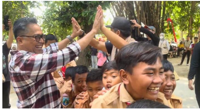
Gambar 1. Ayah Bermain Permainan Tradisional Dengan Anak