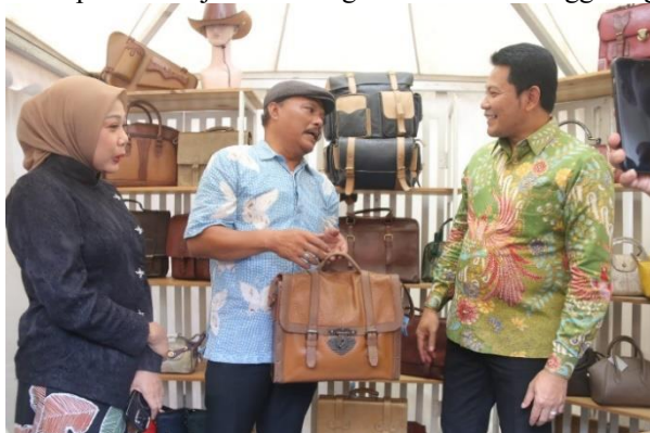
Gambar 2. Bupati Sidoarjo Saat Menghadiri Acara "Tanggulangun Fair"