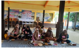
Gambar 4. Kegiatan Posyandu di Balai Desa Kupang, Sidoarjo

"Harapan saya sebagai kader tentunya untuk posyandu di Desa Kupang ini lebih baik. Kami berharap bisa mendapat pelatihan langsung dari puskesmas, karena tidak semua kader menguasai semua keterampilan. Kami ingin minta ke desa untuk mengadakan pelatihan agar semua kader bisa merasakan. Walaupun sudah ada pembagian tugas masing-masing, tapi kami harus bisa menguasai tugas yang lain juga agar bisa saling menggantikan. Di Desa Kupang ini pernah ada tes untuk kader, tapi kami sendiri yang mengawasi dan memantainya. Kami ingin tahu sejauh mana pemahaman mereka tentang posyandu dan tugas-tugas kader." (Wawancara, 20 September 2025).