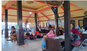
Gambar 2. Kegiatan Posyandu Desa Kupang, Sidoarjo

Pernyataan ini mengungkapkan bahwa ketidaksamaan dalam akses ke pelatihan yang menyebabkan gap kompetensi, adanya ketidaksetaraan tugas yang tidak sejalan dengan kemampuan yang mencakup 25 keterampilan dasar, termasuk keterampilan administratif dan teknis, serta digitalisasi yang sulit dikuasai oleh kader senior. Kondisi ini menunjukkan bahwa masalah peran aktif kader bukan hanya berhubungan dengan hal-hal teknis, namun juga dengan bagaimana organisasi posyandu berjalan di dalamnya. Efektivitas sistem rotasi dan kualitas pelayanan secara keseluruhan dipengaruhi oleh ketimpangan dalam penguasaan keterampilan dasar dan resistensi terhadap regenerasi. Menurut teori peran Soekanto, keadaan ini menunjukkan bahwa peran aktif belum sepenuhnya ideal karena fungsi dan tanggung jawab belum didistribusikan secara merata sesuai dengan kemampuan anggota. Oleh karena itu, untuk menjaga keberlanjutan pelayanan kesehatan ibu hamil di Desa Kupang, diperlukan penataan ulang mekanisme pembagian tugas, peningkatan pelatihan berbasis kebutuhan, dan pendekatan persuasif dalam proses regenerasi kader.