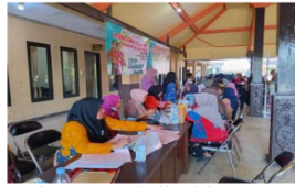
Gambar 3. Kegiatan Posyandu di Balai Desa Kupang, Sidoarjo

dan sistem regenerasi yang lebih terbuka agar komitmen sosial kader yang sudah baik dapat diimbangi dengan peningkatan kapasitas dan pembagian peran yang lebih adil. Hal ini akan memungkinkan peningkatan kualitas pelayanan ibu hamil secara berkelanjutan dan optimal.