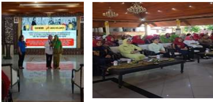
Gambar 4. Sikap dan Partisipasi Perempuan dalam Mengikuti Pelatihan Literasi Digital

jawab domestik, serta adanya pandangan sosial bahwa teknologi digital belum menjadi kebutuhan utama. Kondisi ini menunjukkan bahwa meskipun program secara umum memberikan hasil positif, masih terdapat permasalahan internal dan sosial yang memengaruhi partisipasi. Rendahnya rasa percaya diri dan persepsi negatif terhadap teknologi menjadi faktor penghambat yang tidak dapat diabaikan. Oleh karena itu, keberhasilan program tidak hanya bergantung pada ketersediaan sumber daya, tetapi juga pada komitmen pelaksana dalam membangun motivasi serta perubahan pola pikir peserta.