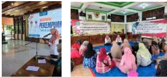
Gambar 6. Koordinasi Pelaksana Program Perluasan Akses Digital

pemerintah desa sebagai fasilitator lokal, kader PKK sebagai pendamping lapangan, hingga kelompok perempuan sebagai penerima manfaat. Setiap tingkatan memiliki peran dan tanggung jawab yang saling berkaitan dalam mendukung pelaksanaan program. Namun, keberlanjutan pelaksanaan masih dipengaruhi oleh ketersediaan anggaran dan kapasitas aparatur di setiap level.