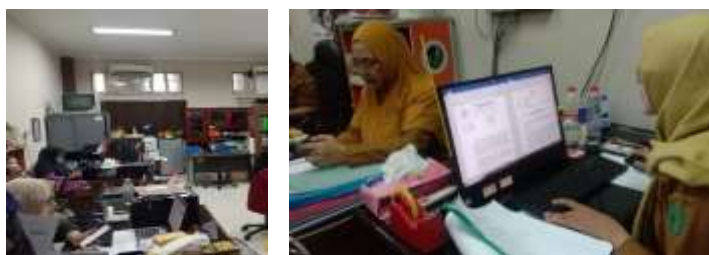
Gambar 3. Ketersediaan Sarana Digital dalam Kegiatan Pelatihan Perempuan