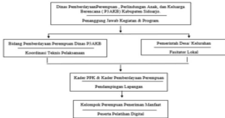
Gambar. 3 Struktur Pelaksana Program Perluasan Akses Digital

Struktur birokrasi dalam pelaksanaan Program Perluasan Akses Digital mencakup kejelasan SOP, pembagian tugas, koordinasi antarinstansi, serta dukungan kelembagaan dan anggaran. Dinas P3AKB Kabupaten Sidoarjo telah memiliki struktur pelaksanaan yang cukup jelas, termasuk koordinasi dengan pemerintah desa, kader PKK, dan pihak pendukung lainnya dalam menjalankan program tersebut. Untuk memastikan program dapat berjalan secara terstruktur dan berkelanjutan, para peneliti meneliti bagaimana mekanisme tugas, koordinasi, dan kerja dikembangkan.