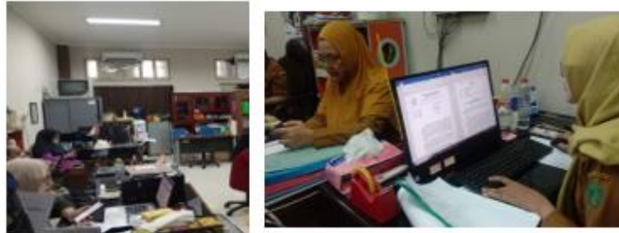
Gambar. 1 Ketersediaan Sarana Digital dalam Kegiatan Pelatihan Perempuan

Sumber daya berperan penting dalam menunjang pelaksanaan Program Perluasan Akses Digital. Sumber daya tersebut meliputi sumber daya manusia, ketersediaan sarana dan prasarana digital, kualitas jaringan internet, serta dukungan anggaran. Dalam pelaksanaannya, program ini telah dilaksanakan secara rutin, namun ketersediaan sumber daya yang ada masih menghadapi berbagai keterbatasan, terutama di wilayah pedesaan. Kondisi ini menunjukkan bahwa kapasitas sumber daya yang tersedia belum sepenuhnya memadai untuk menjawab kebutuhan peserta secara menyeluruh.