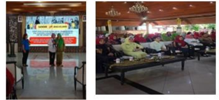
Gambar. 2 Sikap dan Partisipasi Perempuan dalam Mengikuti Pelatihan Literasi Digital

Gambar 2. memperlihatkan keikutsertaan perempuan dalam kegiatan pelatihan Program Perluasan Akses Digital. Dari kegiatan tersebut terlihat adanya perbedaan tingkat partisipasi dan respons peserta selama proses pelaksanaan program. Sebagian peserta tampak aktif mengikuti materi dan berinteraksi dengan fasilitator, sementara sebagian lainnya menunjukkan keterlibatan yang lebih terbatas. Kondisi ini mencerminkan bahwa kesiapan individu, tingkat kepercayaan diri, serta pengalaman sebelumnya dalam pemanfaatan teknologi digital turut memengaruhi partisipasi perempuan dalam program.