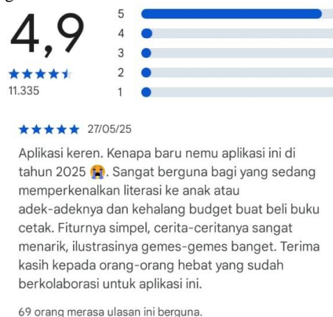
Gambar 1. Ulasan Aplikasi Let's Read di PlayStore

Membaca merupakan keterampilan fundamental yang menjadi dasar bagi seluruh proses pembelajaran peserta didik di sekolah dasar [12]. Kemampuan membaca yang baik tidak hanya mempengaruhi prestasi akademik peserta didik dalam mata pelajaran bahasa Indonesia, tetapi juga berkorelasi positif dengan pencapaian pembelajaran di berbagai bidang studi lainnya. Pada tingkat sekolah dasar, periode ini merupakan masa kritis dalam pembentukan kebiasaan membaca yang akan mempengaruhi perkembangan literasi peserta didik di jenjang pendidikan selanjutnya. Kebiasaan atau kemampuan dasar ini dimulai dari membaca. Minat baca merupakan faktor internal yang sangat menentukan keberhasilan peserta didik dalam mengembangkan kemampuan literasi. Minat membaca merupakan dorongan yang meningkat seiring dengan upaya seseorang dalam melakukan kegiatan membaca [13]. Individu yang mempunyai keinginan membaca yang tinggi akan tercermin dalam kesediaannya untuk memperoleh bahan bacaan dan membacanya atas kesadaran pribadi maupun adanya dorongan luar. Selanjutnya minat membaca merupakan motivasi internal yang mendorong peserta didik untuk terlibat dan menikmati aktivitas membaca secara sukarela, karena adanya rasa tertarik dan kesenangan dalam melakukan aktivitas membaca [14]. Peserta didik yang memiliki minat baca tinggi cenderung akan lebih mudah menyerap informasi, mengembangkan kosakata, meningkatkan kemampuan berpikir kritis, dan memiliki wawasan yang lebih luas.