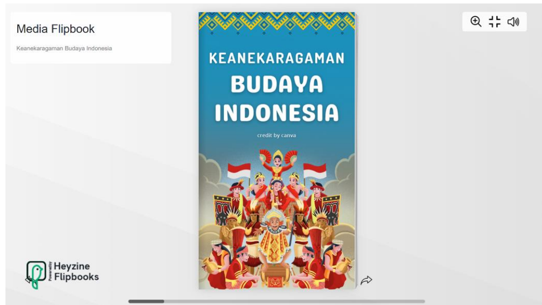
Gambar 2. Tampilan awal media flipbook

Tahap perancangan, yaitu tahap merancang media flipbook dengan aplikasi Canva yang mencakup desain tampilan, pemilihan warna, dan ilustrasi yang sesuai dengan karakteristik siswa kelas 4 SD. Materi yang dibuat dalam flipbook mencakup ragam pakaian adat, rumah adat, makanan khas, tarian adat, senjata tradisional dan alat musik dari berbagai provinsi yang disertai penjelasan singkat. Rancangan media mengacu pada prinsip-prinsip desain instruksional yang menekankan kemudahan penggunaan, kejelasan penyajian, serta kemenarikan tampilan visual.