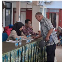
Gambar 1. Proses Penyaluran BLT-DD di Balai Desa Larangan (Dokumentasi Lapangan, 2024)

Sumber: Dokumentasi Peneliti, Balai Desa Larangan, 29 Oktober 2024 (diolah peneliti, 2025)