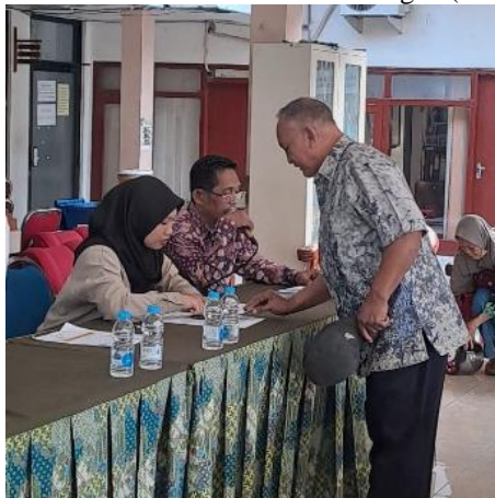
Gambar 1. Proses Penyaluran BLT-DD di Balai Desa Larangan (Dokumentasi Lapangan, 2024)

Sumber: Dokumentasi Peneliti, Balai Desa Larangan, 29 Oktober 2024 (diolah peneliti, 2025)