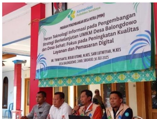
Gambar 2. Kerja sama antara Pemerintah Desa Balongdowo dan Poltekkes Surabaya melalui Program Pengembangan Desa Mitra (PPDM)

Kutipan ini mencerminkan adanya dampak katalitik yang signifikan, di mana pelaku UMKM mulai berinisiatif memanfaatkan media digital dalam menjalankan bisnis setelah mendapatkan arahan awal dari pelatihan yang diadakan oleh pemerintah desa. Dengan kata lain, meskipun aktivitas tersebut belum berjalan secara teratur, pemerintah desa telah berhasil menciptakan kesadaran baru serta perubahan perilaku masyarakat menuju digitalisasi bisnis.