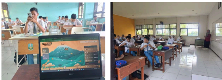
Gambar 2. Peran Media Digital sebagai Sarana Dakwah Kreatif

langsung memperdalam pemahaman mereka terhadap materi agama sekaligus melatih soft skill di bidang komunikasi digital. Siswa belajar bahwa menyebarkan kebaikan bisa dilakukan hanya dengan satu klik, dan setiap konten positif yang mereka bagikan memiliki nilai ibadah. Hal ini menumbuhkan semangat syiar Islam yang inklusif dan relevan dengan gaya hidup modern mereka sehari-hari[22].