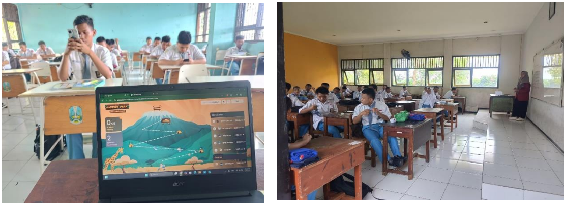
Gambar 2. Peran Media Digital sebagai Sarana Dakwah Kreatif

Fenomena "Klik, Belajar, Beribadah" menjadi terminologi baru yang menggambarkan kemudahan akses ilmu agama di era digital ini. Siswa dapat dengan mudah mencari referensi tata cara ibadah, hukum Islam, atau sejarah nabi melalui aplikasi terpercaya di gawai mereka. Aktivitas pencarian ilmu ini, jika diniatkan dengan benar, bernilai ibadah tersendiri. Namun, kemudahan ini juga menuntut peran guru sebagai kurator dan fasilitator. Guru PAI harus aktif membimbing siswa agar mampu memilah sumber informasi yang valid di tengah banjirnya informasi keagamaan di internet yang belum tentu benar. Guru juga perlu menanamkan etika digital (digital ethics), mengajarkan siswa untuk santun dalam berkomentar dan bertanggung jawab atas konten yang disebar. Dengan demikian, media digital tidak hanya berfungsi sebagai sumber informasi, tetapi juga sebagai ladang amal jariyah bagi siswa dan guru dalam menyebarkan nilai-nilai Islam yang rahmatan lil 'alamin.