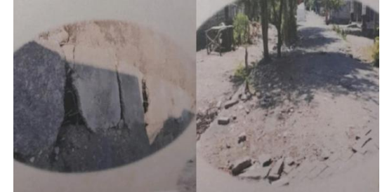
Gambar 2. Jalan Desa Tambak Kalisogo