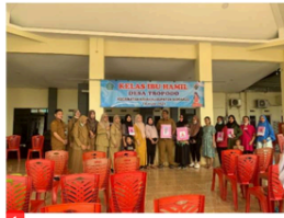
Gambar 1. Kegiatan Kelas Ibu Hamil

Berdasarkan hasil penelitian, pada indikator ketersediaan anggaran, pemerintah Desa Tropodo melakukan pekerjaan yang sangat baik dalam mengawasi dan mendistribusikan dana desa. Anggaran yang dialokasikan untuk berbagai program pencegahan stunting jelas mencerminkan hal ini. Pengeluaran untuk hal-hal seperti kelas prenatal, kunjungan ke balita yang mengalami stunting, biaya transportasi untuk kader, suplementasi makanan untuk anak-anak yang mengalami stunting, dan Posyandu (pos layanan kesehatan terpadu) untuk balita semuanya tercakup dalam anggaran desa. Pemerintah desa berupaya keras untuk memastikan program pencegahan stunting dapat terus berlanjut dengan pemanfaatan anggaran ini.