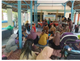
Gambar 2. Kegiatan Kemitraan