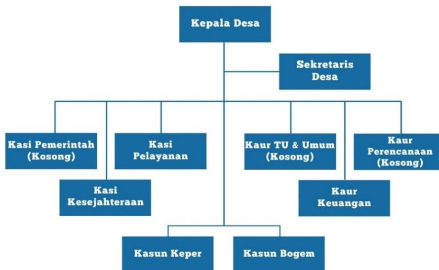
Gambar 2. Struktur Organisasi Pemerintah Desa Keper

Menurut Charles O. Jones (1996), aspek organisasi dalam implementasi kebijakan berkaitan dengan kesiapan struktur pelaksana, meliputi kejelasan pembagian tugas dan wewenang, ketersediaan sumber daya manusia yang kompeten, koordinasi antarunit, serta dukungan sarana dan prasarana. Struktur organisasi yang tertata dengan baik mampu memberikan arahan yang jelas mengenai pembagian tugas dan fungsi setiap perangkat desa sehingga dapat mendukung terciptanya sumber daya manusia yang kompeten [12]. Dalam implementasi Indeks Desa di Desa Keper, melibatkan seluruh perangkat desa yang memiliki tanggung jawab administratif. Hal ini sejalan dengan ketentuan Permendagri Nomor 84 Tahun 2015 tentang Susunan Organisasi dan Tata Kerja Pemerintah Desa yang menekankan pentingnya pembagian fungsi dan jabatan secara proporsional agar penyelenggaraan pemerintahan berjalan efektif. Berikut merupakan struktur organisasi Pemerintah Desa Keper: