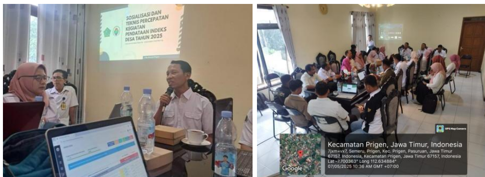
Gambar 3. Sosialisasi Indeks Desa

Temuan di lapangan menunjukkan bahwa perangkat Desa Keper masih menghadapi tantangan dalam menafsirkan perubahan kebijakan dari Indeks Desa Membangun (IDM) menjadi Indeks Desa (ID). Perubahan tersebut membawa perbedaan format, indikator, dan sistem penilaian yang memerlukan pemahaman ulang oleh pelaksana, khususnya operator aplikasi. Di Desa Keper, pemahaman yang jelas mengenai tugas operator dapat tercapai apabila didukung oleh sosialisasi. Hal ini sejalan dengan pendapat Charles O. Jones (1996) proses sosialisasi merupakan sarana untuk menerjemahkan kebijakan dari tingkat pembuat keputusan ke tingkat pelaksana agar terjadi kesamaan pemahaman.