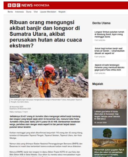
Gambar 2. Screenshot media berita BBC News Indonesia terkait banjir dan longsor di Sumatera pada 26 November 2025 (diperbarui 29 November 2025)

Dalam kajian komunikasi, media tidak sekadar menyampaikan fakta, tetapi juga mengonstruksi realitas melalui seleksi informasi dan penonjolan aspek tertentu. Proses tersebut dapat memengaruhi bagaimana publik memahami “apa masalah utama”, “siapa atau apa penyebabnya”, dan “solusi apa yang dianggap tepat” [4], [5], [6]. Karena itu, pemberitaan bencana layak dibaca tidak hanya sebagai informasi, melainkan juga sebagai produk wacana yang membentuk pemaknaan sosial [7], [8].