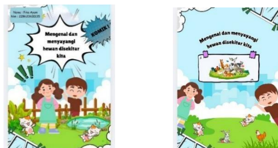
Gambar 2. Halaman awal dan akhir komik edukatif

dinyatakan layak digunakan dengan beberapa saran perbaikan yang bersifat penyempurnaan. Pada artikel ini ditampilkan halaman awal dan akhir sebagai produk yang dikembangkan.