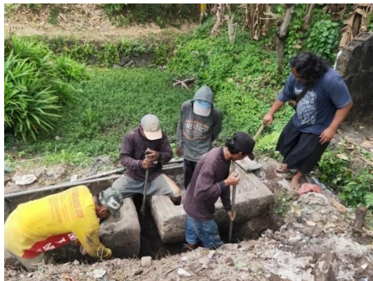
Sumber 9 Dokumentasi Observasi