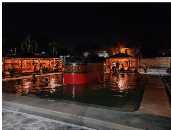
Sumber 5 Dokumentasi Observasi

Gambar di atas memperlihatkan beberapa infrastruktur yang telah dibangun, antara lain jalur pedestrian, area parkir, dan gazebo sebagai tempat istirahat pengunjung. Keberadaan infrastruktur ini menunjukkan bahwa BUMDes telah bergerak dari tahap perencanaan menuju implementasi nyata. Pembangunan dilakukan secara bertahap dengan mengutamakan fungsi dan estetika yang selaras dengan kondisi alam sekitar. Namun demikian, berdasarkan observasi lapangan dan wawancara dengan pengelola, masih ditemukan beberapa keterbatasan infrastruktur. Area parkir yang tersedia belum mampu menampung kendaraan pengunjung saat akhir pekan atau hari libur. Toilet umum masih perlu perawatan lebih intensif, dan jumlah gazebo belum sebanding dengan rata-rata kunjungan harian. Kondisi ini mengindikasikan bahwa pembangunan infrastruktur belum sepenuhnya responsif terhadap peningkatan jumlah pengunjung sebagaimana ditunjukkan pada Tabel 1. Dengan demikian, meskipun implementasi strategi di bidang infrastruktur telah berjalan, masih diperlukan pengembangan lebih lanjut baik dari segi kuantitas maupun kualitas fasilitas. BUMDes perlu menyusun prioritas pembangunan jangka menengah yang berbasis pada proyeksi pertumbuhan pengunjung, agar infrastruktur yang dibangun benar-benar dapat memenuhi kebutuhan pengunjung secara berkelanjutan.