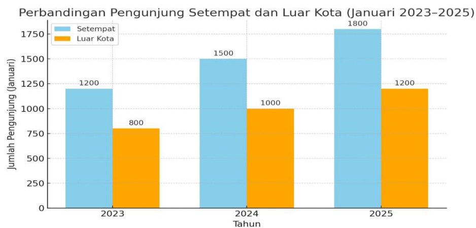
Table 2 Grafik Perbandingan pengunjung setempat dengan pengunjung luar kota

Untuk memperkuat analisis mengenai efektivitas perencanaan strategi yang telah dilakukan, berikut disajikan data perbandingan antara pengunjung setempat (lokal) dengan pengunjung luar kota selama periode 2023–2025. Data ini penting untuk melihat sejauh mana strategi pengembangan wisata yang dirancang BUMDes berhasil menjangkau pasar yang lebih luas, tidak hanya bergantung pada wisatawan lokal.