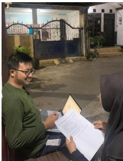
Gambar 5 wawancara dengan tutor

yang tidak baik juga. Jika hal seperti itu dibiarkan, kelas menjadi tidak kondusif dan peserta didik yang lain tidak dapat belajar dengan maksimal[30].