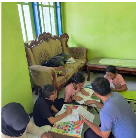
Gambar 2 Kegiatan Pembelajaran

Sedangkan secara pengetahuan, peserta didik mampu menunjukkan bahwa mereka memahami materi dengan baik karena metode yang digunakan oleh tutor sesuai dengan gaya belajar mereka.