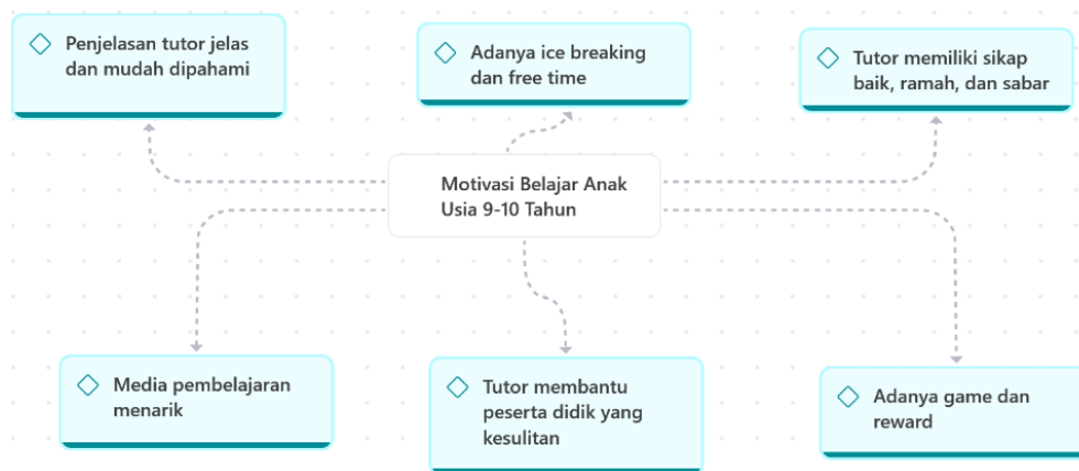
Gambar 3 Hasil Analisis Motivasi Belajar Anak usia 9-10 Tahun

Dari hasil analisis motivasi belajar peserta didik, mereka merasa antusias mengikuti les privat karena adanya berbagai aktivitas yang membuat pembelajaran menjadi menyenangkan. Beberapa anak menyebutkan bahwa mereka sangat menyukai saat sesi les diselingi dengan game, ice breaking, dan pemberian hadiah. Ice breaking merupakan salah satu kegiatan yang penting dalam pembelajaran di lembaga les privat, khususnya bagi peserta didik usia 9–10 tahun. Ice breaking dilakukan di awal atau di sela-sela pembelajaran untuk mencairkan suasana dan mengurangi rasa jenuh anak. Melalui kegiatan sederhana seperti permainan singkat, tanya jawab ringan, atau gerakan tubuh, peserta didik menjadi lebih rileks dan siap mengikuti pembelajaran[18]. Tutor juga memberi waktu istirahat ketika anak terlihat lelah, misalnya dengan memberikan waktu untuk makan dan minum sebelum melanjutkan belajar. Aktivitas seperti hal tersebut dapat disebut dengan dinamika pembelajaran yang adaptif yaitu pembelajaran yang mampu menyesuaikan kondisi fisik, emosi, dan minat peserta didik[19]. Variasi dalam pembelajaran tersebut terbukti mampu meningkatkan keterlibatan anak dalam pembelajaran.