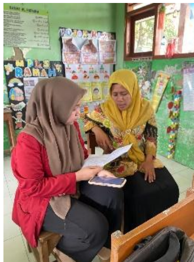
Gambar 7. Wawancara Guru