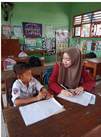
Gambar 4 . Wawancara Peserta Didik MAU