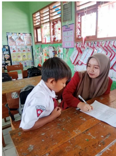
Gambar 6. Wawancara Peserta Didik ENP