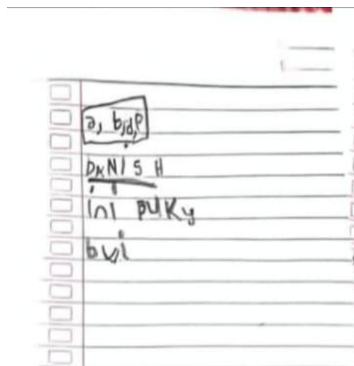
Gambar 2. Hasil Tulisan Peserta Didik MDA