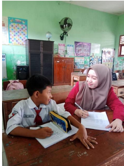
Gambar 5. Wawancara Peserta Didik MDA