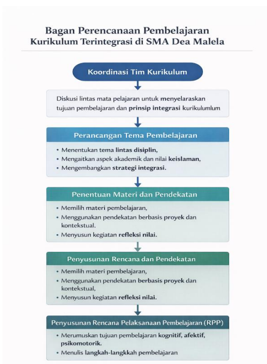
Bagan I. Perencanaan Pembelajaran

Observasi pada rapat koordinasi akademik memperlihatkan bahwa proses ini turut memberikan kerangka kerja yang seragam bagi para guru dalam mengimplementasikan model pembelajaran terintegrasi, sehingga potensi ketidaksinkronan antar mata pelajaran dapat diminimalisasi. Salah seorang guru ISS menjelaskan bahwa “pertemuan koordinasi itu membuat kami punya pegangan yang sama. Jadi integrasinya tidak hanya ada di kepala masing-masing guru.” (W5) Hal ini menegaskan bahwa kualitas implementasi kurikulum terintegrasi sangat ditentukan oleh kekuatan perencanaan awal yang tidak hanya bersifat teknis, tetapi juga mencerminkan pemahaman filosofis terhadap tujuan pendidikan holistik.[32]