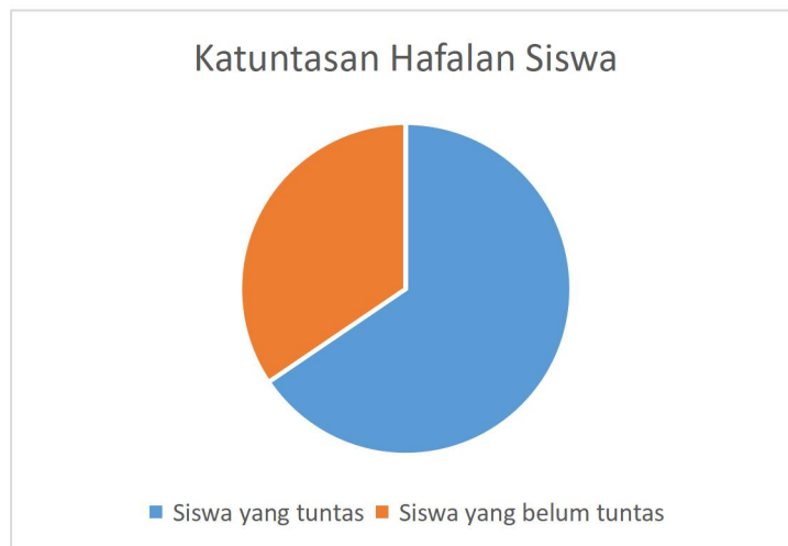
Gambar 2. Ketuntasan Hafalan Siswa Kelas 2

Dari total 29 peserta didik kelas 2, sebanyak 19 peserta didik telah mencapai ketuntasan hafalan Juz 29, sedangkan 10 peserta didik lainnya belum mencapai ketuntasan hafalan sesuai dengan target yang ditetapkan.