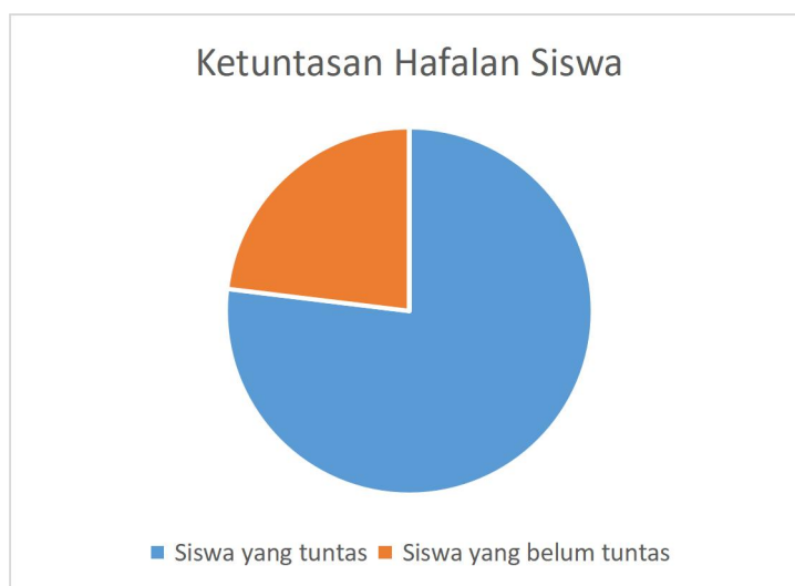
Gamber 3. Ketuntasan Hafalan Siswa Kelas 3

Dari total 26 peserta didik kelas III, sebanyak 20 peserta didik telah mencapai ketuntasan hafalan juz 28, sedangkan 6 peserta didik lainnya belum mencapai ketuntasan hafalan sesuai dengan target yang ditetapkan.