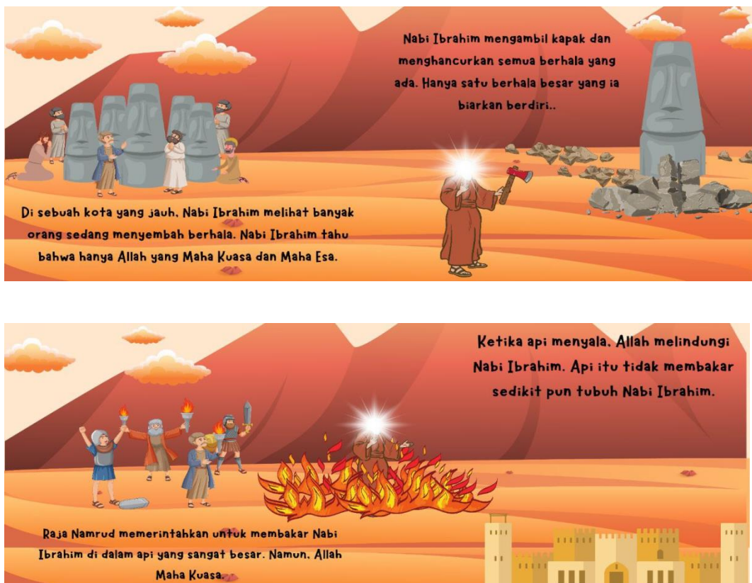
Gambar 2. Tampilan Desain Pop Up Book

Desain Pop Up Book ini dirancang sebagai medai pembelajaran interaktif yang menggabungkan unsur visual, tekstur dan juga gerak untuk dapat menyampaikan kisah sejarah Nabi Ibrahim AS secara menarik dan edukatif. Buku ini ditujukan untuk peserta didik jenjang pendidikan dasar sebagai bagian dari materi Pendidikan Agama Islam (PAI), khususnya pada tema keteladanan para nabi.