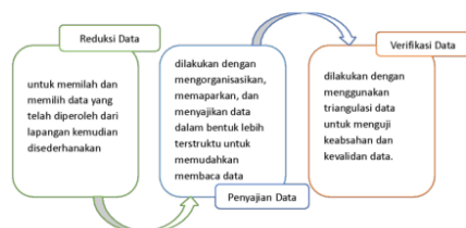
Gambar 1. Teori Analisis Data Miles & Huberman.

Pengumpulan data dilakukan dengan beberapa cara, yaitu: (1) Observasi secara langsung pada saat pembelajaran Al-Islam berlangsung di kelas antara guru dengan siswa untuk dapat mengetahui situasi pembelajaran secara langsung. (2) Wawancara semi terstruktur, yang ditunjukkan secara langsung kepada guru Al-Islam dan guru pendamping (GPK), untuk memperoleh pengetahuan mengenai strategi, dan teknik pembelajaran yang digunakan oleh guru Al-Islam selama mengajar di SD Muhammadiyah 1 Taman. (3) Dokumentasi, dilakukan dengan mengkaji secara langsung dari dokumen-dokumen pendukung terkait yang mencakup: RPP, modul ajar, buku ajar, buku pegangan guru, serta media pembelajaran yang digunakan. Teknik Analisis data berdasarkan gambar 1. Dilakukan dengan menggunakan teori Miles & Huberman (1992) dengan melalui tiga tahapan, yakni: 1). Reduksi data. 2). Penyajian data. 3). Verifikasi data.