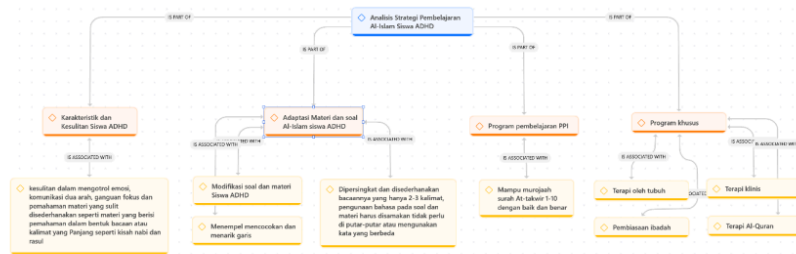
Gambar 7. Hasil wawancara analisis strategi pembelajaran Al-Islam siswa ADHD