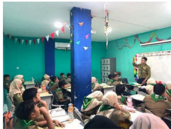
Gambar 3. Kegiatan pembelajaran Al-Islam yang berlangsung di kelas inklusi.

Kolaborasi guru Al-Islam antara GPK menjadi faktor utama dalam keberhasilan penerapan pembelajaran Al-Islam di kelas inklusi. GPK berperan dalam mengidentifikasi hambatan siswa ABK, kemudian memberikan laporan kepada guru Al-Islam untuk ditindak lanjut melalui strategi pembelajaran yang lebih privat dan intensif. Demikian pula, dengan guru Al-Islam harus bisa memahami karakteristik dan hambatan yang dimiliki siswa ABK. Sebagai contoh, pada siswa hambatan retardasi mental dan ADHD yang mengalami kesulitan dalam membaca, berbicara dan mengingat. Karena itu guru Al-Islam harus memahami kondisi setiap anak. Seperti materi membaca Al-Quran pada surat Al-Alaq, At-Thariq dan Al-Buruj. Siswa ABK diberi keringanan dengan membaca atau menghafal beberapa ayat dari satu surah. Sebagai bentuk dukungan penuh dalam pembelajaran siswa berkebutuhan khusus secara individu, GPK menyusun Program pembelajaran individu (PPI). PPI menempatkan siswa ABK sebagai fokus utama, dengan tetap memperhatikan situasi, kondisi serta karakter kebutuhan khusus masing-masing siswa [33]. Berdasarkan gambar 3. Proses kegiatan pembelajaran Al-Islam di kelas inklusi berlangsung dengan baik.