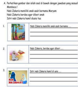
Gambar 4. Modifikasi soal AI-Islam siswa retardasi mental ringan SD Muhammadiyah 1 Taman.

Selain itu Guru memberikan beberapa program pendukung seperti; 1) Pembiasaan ibadah dengan tujuan untuk memahami tata cara berwudhu yang benar, shalat dan dzikir menggunakan media gambar, video, perlengkapan sholat dan lembaran dzikir. Sehingga siswa bisa menirukan Gerakan dan melakukannya secara mandiri dan benar. 2) Terapi Al-Quran untuk membantu pengendalian emosi agar lebih stabil. 3) Terapi olah tubuh untuk melatih keseimbangan, reflek, konsentrasi maupun motorik, dengan media papan titian, papan pola tangan kaki, tali skipping dan bola. 4) Terapi klinis yang bertujuan untuk melatih konsentrasi dalam belajar maupun akademik. Gambar 5 ini menunjukkan temuan hasil wawancara terkait penerapan strategi pembelajaran AI-islam bagi siswa retardasi mental ringan