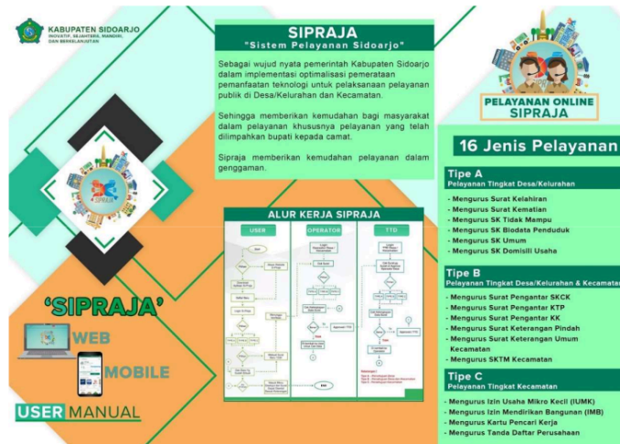
Gambar 1. Pelaksanaan SIPRAJA

Berdasarkan ilustrasi tersebut, Sistem Pelayanan Rakyat Sidoarjo (SIPRAJA) adalah sebuah platform layanan publik yang berbasis digital dan dirancang untuk meningkatkan efisiensi serta keterbukaan dalam pelayanan. Sistem ini melibatkan tiga elemen utama, yaitu masyarakat sebagai pengguna, operator, dan proses pengesahan dokumen melalui tanda tangan elektronik. Warga sebagai pengguna mendapatkan informasi melalui sosialisasi yang dilakukan oleh pemerintah desa dan dapat mengajukan berbagai layanan administrasi secara online, memantau perkembangan permohonan, dan menerima pemberitahuan sampai dokumen siap untuk dicetak. Operator desa bertanggung jawab untuk memvalidasi dan memproses permohonan sesuai dengan prosedur yang ada, sekaligus memberikan dukungan kepada RT dan RW untuk membantu masyarakat. Setelah itu, dokumen yang telah diverifikasi akan disahkan oleh pejabat berwenang dengan menggunakan tanda tangan elektronik, yang memastikan keabsahan dokumen tersebut. Proses ini menunjukkan pembagian tugas yang jelas di antara para pemangku kepentingan dalam SIPRAJA untuk mendukung pelayanan publik yang lebih efisien dan transparan.